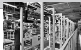
工場ラインの様子