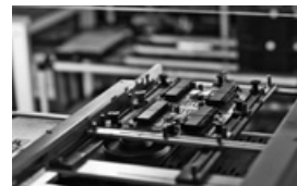
工場ラインの様子