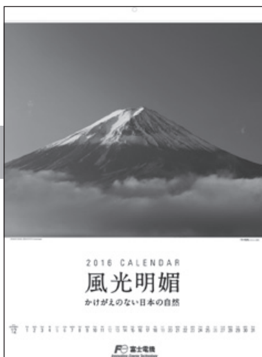
写真は2016年版カレンダー

是非、株主の皆様にお読みいただき、富士電機の企業活動についてご理解を深めていただければ幸いです。