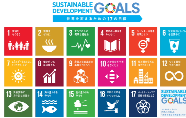
「持続可能な開発目標(SDGs)」

CSRの推進にあたっては、会社と全従業員が価値観を共有し、一丸となって行動するための指針として全6項目からなる「富士電機企業行動基準」を定めています。企業行動基準には国連が提唱するグローバル・コンパクト(GC)の4分野10原則を反映させ、これをベースにESG視点で課題を設定し、その実践に取り組んでいます。さらに国連サミットで採択された「持続可能な開発目標(SDGs)」に対し、富士電機は事業活動を通じてこの目標達成に取り組み、持続可能な社会の実現に貢献します。