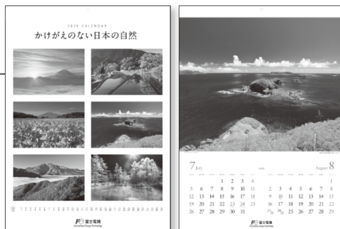
写真は2020年版カレンダー