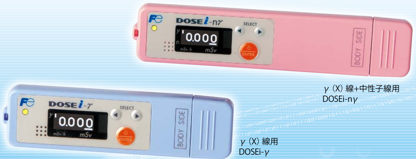
γ (X) 線+中性子線用 DOSEi-nγ