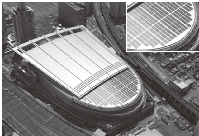
図3 さいたまスーパーアリーナ