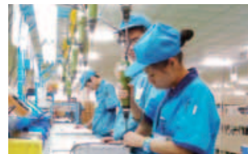
無錫富士電機の生産現場