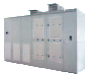
中国市場での販売拡大をめざす高圧インバータ