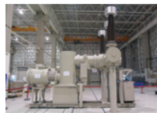
ガス絶縁開閉装置

アジア・欧米向けパワエレ機器(インバータ、無停電電源装置など)の中核生産拠点である富士電機マニュファクチャリング(タイランド)社にて、変電機器(ガス絶縁開閉装置)に加え、中国・アジア向け自動販売機「Twistar」の生産を開始し、複数事業の生産拠点として稼働が本格化しました。