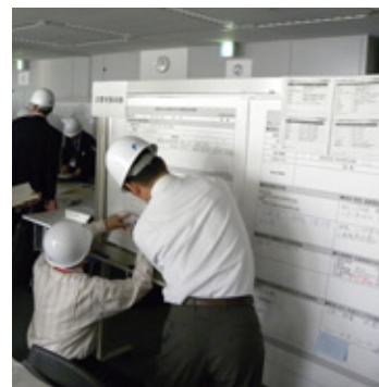
大規模災害模擬訓練の様子