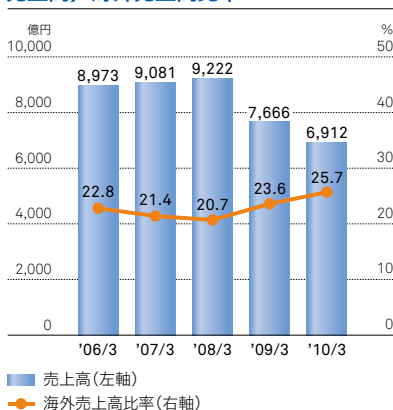
売上高/海外売上高比率