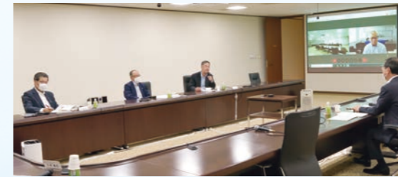
社外役員座談会の様子