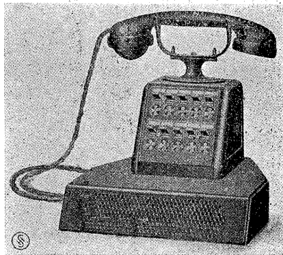
第二圖 一般加入者電話機

に、居ながらにして話をしたり或は聽いたりすることが出来る。各加入者からの言葉は擴聲器にて擴大せられて聽え、又首席者室内の各人の言葉はマイクロホンによつて各加入者に傳へられる。此補足裝置は非常に便利なもので、之に依つて、首席者は一々往復したり、ファイル等をめくつたり或は備忘録を作つたり等することの煩雜を省くことが出来る。擴聲器及びマイクロホンを送受器へ切換へるに