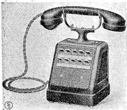
第三圖 主席者電話機

首席電話機に於て特に興味あることは、非常に鋭敏なマイクロホンと擴聲器とが裝置されてあるとである。擴聲器は本電話機の底部擴大部分の中に、又マイクロホンはその側面に裝置されてあつて、之は外部からも見える。即ち首席電話機に於ては、別に送電話器を使用せず