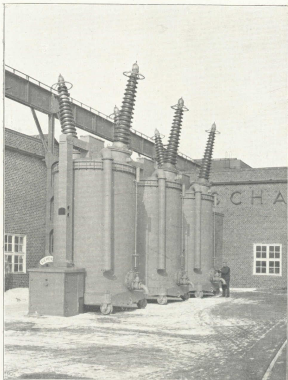
220,000 V. 630 A 屋外用自働油入遮断器 獨特の多重遮断式で Condenser bushing を用ひ、操作用電動機 の所要電力は僅かに 11KW であります。