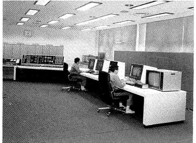
図1 管理システムの管理室

システムの中核となるコンピュータは、32ビットスーパーミニコンピュータ(Sシリーズ)から小形ミニコンピュータ(Uシリーズ)を規模機能に応じて採用する。マイクロプロセッサはシーケンス制御、ループ制御などのデジタル機器を下位コントローラとして採用した(MICREXシリーズ)。