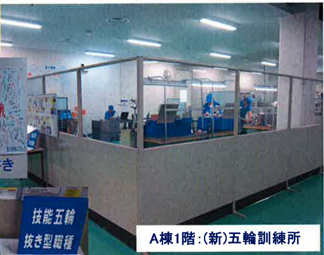
A棟1階:(新)五輪訓練所