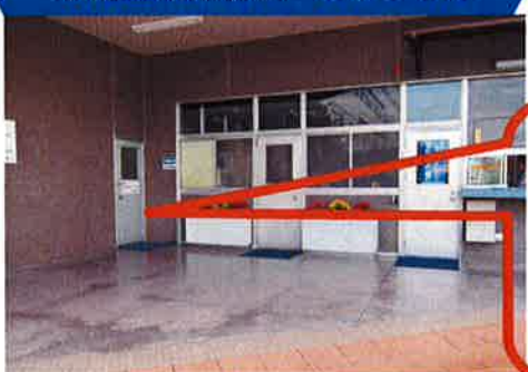
技能五輪訓練所へのアクセス

埼玉地区受付横の ドアを入り直ぐ右側 に「五輪訓練所」 があります。見学 ご希望の方は FFT総務(内3122)迄 ご連絡ください。