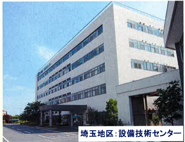
埼玉地区:設備技術センター