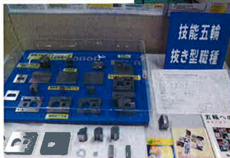
技能五輪 抜き型磁種