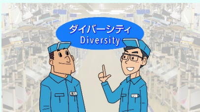
e-ラーニング動画 (10分)