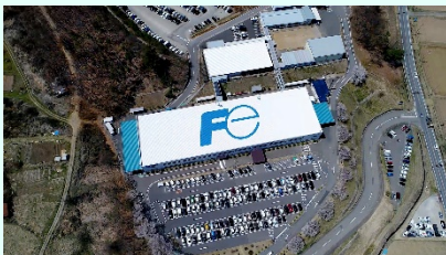
会社・工場案内動画 (2分)