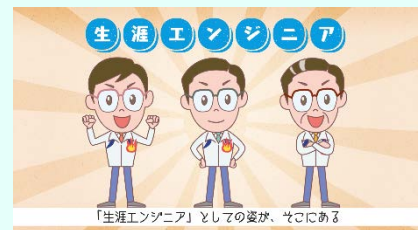
リクルート向け動画 (3分)