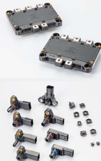
美しい環境の中で生み出される製品は、世界中のお客様ニーズに応えています。

母体である富士電機株式会社の経営スローガン「熱く、高く、そして優しく」を、当社でも大事にしています。お客様、仲間、家族、地域を大切に思う優しさが浸透している会社なので、雰囲気もよく働きやすいと思います。パワー半導体ビジネスは将来性があり、今後ますます伸びる分野です。そういった意味でも安心して働いてもらえると自負しています。