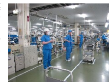
午後の作業のために！ (リフレッシュ体操)