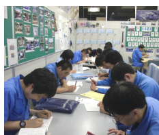
全員合格頑張ろう

私は、六月十七日に漢字検定を受けました。学生時代に戻ったみたいです。過去に何回か漢字検定を受けたことがありません。「社会人になっても漢字は大事だなあ」と思いました。世の中、漢字が苦手な人・好きな人沢山います。今こそ漢字勉強をもっともっと勉強して、わからない人に教えてあげるべきだと思えます。近頃七月入って「合格・不合格通知の発表が気になる人がいます。フロンティアで初めての受験でしたが、合格・不合格関係なく漢字に取り組んだのではないのでしょうか?」またいつか漢字検定を実施する時は、次の目標に向かって頑張ります。