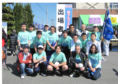
今年も完走をめざして!

ソンを始め6年目を迎えました。平成二十四年四月十一日当日桃源郷マラソンには、大崎のフロンティアの社員と、川崎のフロンティア社員と一緒に走りました。またいつか機会があったら川崎のフロンティア社員と、大崎のフロンティア社員と走りたいです。これからも継続して日々トレニングに励みたいと思います。マラソンが終わって疲れしましたが、完走出来た事に満足です。応援に来てくれたスタッフに感謝します。