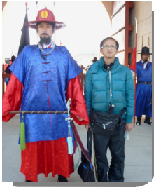
イサン?と記念写真

今回の旅行は一人旅だったのでパスポートを取ったり旅行会社とのやり取りも一人でこなしました。行きは羽田空港でした。そして韓国のソウル空港に着いたら軍隊がマシンガンを持ち歩いていました。正直びっくりしました。初めて海外に一人で行き、日本と文化の違いに戸惑いました。でも周りを見ると日本からの旅行者がいてホッとしました。マクドナルドやセブンイレブンがありビックリしました。今回韓国旅行を決めたのは韓国ドラマや南北戦争の歴史を知りたいためでした。宮殿の見学に行ったときドラマのイサンみたいな人に逢って嬉しかったです。またピストル撃ちの経験もりましたが怖くなりました。ぼくが一番不便に感じたことは日本のニュースや新聞が手に入らなかったことです。またテレビもあまり楽しくなかったです。次にまたお金を貯めて違う国に行ってみたいと思っています。