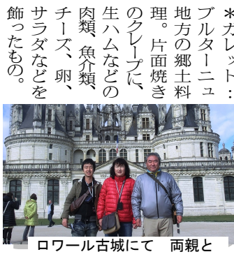
ロワール古城にて 両親と

の歴史を学び、下のショップで香水を買いました。次に百貨店へ行き、靴や時計やキャンダルを買いました。その日の夜は、ディナークルーズで最高の料理を食べ、シャンソンを聴きました。この旅行は生涯忘れられない程に楽しく、感動的で、ぜひまた行きたいと思いました。