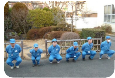
号令にあわせて1. 2. . .