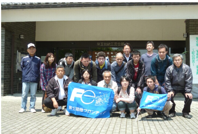
林社長をかこんで！

職場に1日5回の集配をこなしている。「一日も早く指導員を頼らずメールの仕事が出来ること」を目標に暑さに負けず頑張っております。