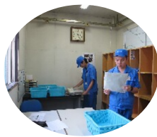
うーん？この職場は！

埼玉Grも2名のスタッフの基3名の社員が慣れない清掃やメールに『早く仕事を覚えたい』と意気込みを強く感じました。