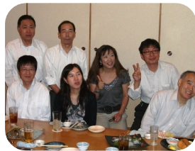
新旧スタッフの皆さん

今後、両名に川崎指導員を加えた四名で、これまでの伝統を元に、社員とスタッフが一体となって新しい事業所を作って行きたいと考えています。皆さん、来社されたときは是非お茶でも飲みに来てください。(池藤)