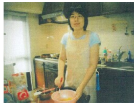
お菓子作りに夢中です

私の趣味はお菓子作りです。中学の先生にお菓子の本を見せてもらったことがきっかけで、お菓子作りに興味を持ち始めました。おもしろいお菓子がいっぱい載っていて自分も作ってみたいと思う気持ちになりました。ホットケーキやクッキーは作ったことはいりましたが、ほかのお菓子にも挑戦してみたいと思いました。まず本を見て作って見たのはチーズケーキです。必要な材料や道具を買いに行き材料の準備や分量を量り、お菓子作りに取りかかりました。レシピ通りに作ってもうまくいかず失敗することもありました。何度も作っていきうちにうまく出来るようになってきました。見た目は良くなっても味はおいしく出来上がりました。中学生の時は、バレンタインデーにチョコやクッキーを作り、ラッピングして先生やお友達に渡しました。とても喜んでくれたのでうれしかったです。羽生ふじ高等学校では、生活技術科のフードデザインコースに入り、今まで作ったことがないお菓子やパンの作り方を習いました。この高校に入って、いろいろなお菓子作りができて良かったです。これからは難しいお菓子作りにも挑戦していきたいです。