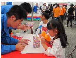
子供や女性に大人気!

私は初めてワークフェアに参加してお客さんに、図面折と花びん作りを教えることが出来ました。一日目は緊張のあまり何をしたらか考えても覚えていない位でしたが、花びん作りには若い人年配の人、そして小さい子供達も来てくれて一緒にやる事が出来たのも良かったです。二日目は前日よりお客さんが来てくれて出展ブースも午前中から活気づいていました。またお客さんに教えるだけでなく普段会えない他事業所の人達との交流も出来ました。今回は初めてお客さんに説明をしたり作ったりで、途中から仕事で来て