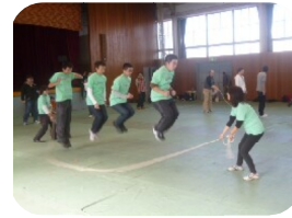
来年に向けてジャンプ

お昼は寒かったので、とん汁、ラーメン、ポテト、たこ焼きを食べました。おいしかったです。残念ながら最下位でした。来年は一位を目指したいです。