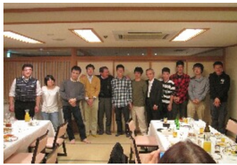
激励をかねた懇親会

材を受け翌朝の新聞にはフルーボーイとオールドボーイがしっかりと写り紹介された。 アピリンピックが2会場に分散したためかワークへの来場者が少なく感じた2日間だったが、イベント中の空いた時間には各事業所の仕事内容を教え合い、お互いの仕事の難しさや理解を深める事が出来た。夜の懇親会を通じ事業所間の交流も一段とパワーアップした。この出展により外部への富士電機フロンティアの知名度・認知度を長野から十分に発信できたかと思ふ。 今回のアピリンピック・ワークフェアを通じ、フロンティアの全社員が結果できると確信したし、社員間の交流と更なる意欲の向上を指して全事業所の集結を約束したい。 最後に、今回出展のまとめ役を東京が担当しましたが、各事業所の多大なご協力を得て無事に終えることが出来たことに事業所の代表として感謝申し上げます。 (東京 平・渡辺)