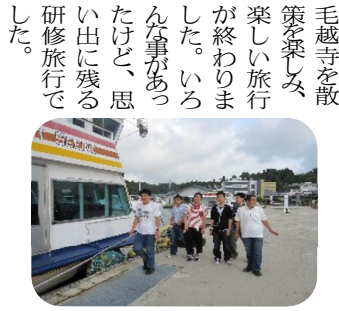
仲間と松島を散策中

私の趣味は、ミシンで色々な物を作る事です。巾着袋、ミニトートバック、ペン入れなどと色々作ります。本を見て難しい物でも挑戦するつもりです。