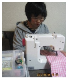
初任給で購入しました

ミシンの楽しさを知った今、自分のミシンを買い、少しずつ難しい物を挑戦するため本や色々な小物を買って揃えつつでも挑戦出来るようになっていきました。私は細かい作業や一人になって集中するのが大好きです。私の得意な事は、子供の世話です。子供と一緒に遊んで子供とのコミュニケーションをとるのも得意ですが、子供の食事から服の着替えさせる事など子供が一人で出来ない事をお手伝いをする事が大の得意です。子供の気持ちになって色々と考えながら子供とのやりとりをしています。子供の顔を見るときはお世話をしたくなります。子供のお世話は私に言えば喜んでお手伝いします。