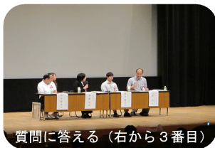
質問に答える(右から3番目)

7月12日の金曜日に中野ZEROホールで立川通勤寮からシンポジストの依頼がありパネリストとして会場のお客様の前で、寮の生活や会社について約七百人のお客様の前で、せきららに語りました。8分間発表して残りの10分間は、質疑応答でお客様から質問をされた事を受け答えました。中でも印象に残った質問の内容は、会社の給料の金額について質問をされた事です。質問をされた中でも一番悩まされたが他の仕事を働いている人の事を考える私は答える事が出来ませんでした。質問を受けて私は、自分の気持ちと正直に答える事を心がけていました。パネリストとして初出演でしたが、とても貴重な体験をしました。これからも大きな舞台の上で発表する機会があるかも知れませんが、経験を生かして会社の見学会でも上手く対応出来るようになりたいです。