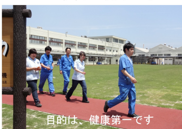
目的は、健康第一です

1周270mのコースを3周歩くと1ポイント。参加は自由でしたが、社員それぞれのペースで参加。商品ゲツトが目的のリフレッシュが目的はさておき、このイベントをきっかけに現在もウォーキングを続けている社員がいます。(永井)