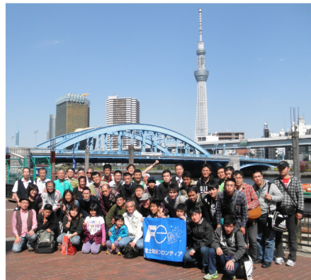
スカイツリーをバックに (川崎・大崎)

後に浅草の船着場で合流しました。今回は屋形船を貸切でした。新人歓迎会本番では大崎と川崎のフロンティアの新人社員や新指導員が意気込みを発表していました。新人社員が意気込みを発表する時、二年前に緊張して発表している自分の事を思い出しました。今年の新入社員が発表している姿は格好良く見えました。次に新入社員はカラオケを順番にしました。又新入社員だけでなく先輩達や僕も歌いました。カラオケは自分でも自信がありました。皆が上手でビックリしました。今回の新人歓迎会は、初めての屋形船での食事があまりにも豪華すぎて感激しました。楽しい一日でした。