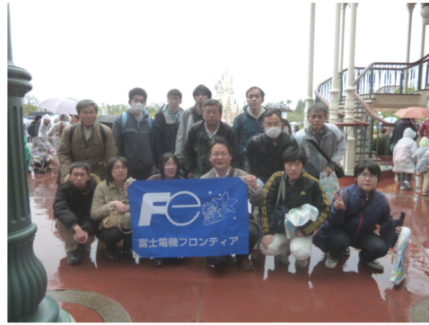
吹上事業所全員集合 (デイズニランド)

したりショッピングをしたりしました。そして念願だったミッキーと一緒に写真を撮ることができてうれしくて感動しました。グループで行動することが楽しかったのでまた機会があったらグループで行きたいです。