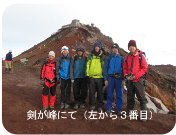
剣が峰にて(左から3番目)

これも週2回仕事帰りにトレーニングをやったおかげです。これからも続けていきたいと思えます。