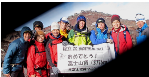
仮称) フロンティア山登り愛好会 ! の面々

世界文化遺産登録年とフロンティア設立20周年と記念すべき良い年に登頂出来ました。富士登山を基に『フロンティア山登り愛好会』が発足しました。(渡辺)