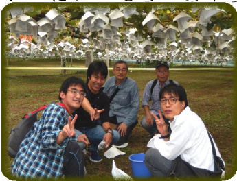
社長・指導員 先輩と一緒に

です。怪我はしなかったです。先生に手伝ってもらいました。出来た竹とんぼは飛ばしてみました。あんまり飛ばなかったです。でも竹とんぼ製作は楽しかったです。帰りの電車は西武特急ちちぶ三十二号の中で社長さんと一緒でしたが、隣で寝てしまいました。母に話したらびっくりしていました。初めての自立実践研修は楽しかったです。フロンティアではカレー作りやティーホー大会がありました。行事がいろいろあって楽しいです。僕はフロンティアに入れて良かったなと思います。