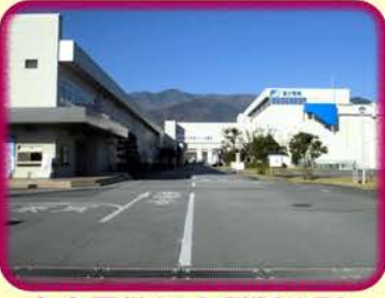
～富士電機(株)山梨製作所～