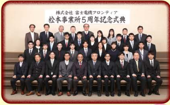
株式会社 富士電機フロンティア 松本事業所5周年記念式典

これまでご支援をいただきました関係者の皆様には感謝の気持ちで一杯です。更に松本の場合、あり難いことに7つの先輩事業所から多くのアドバイスをいただき、助けていただきました。