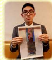
ポコライト 大崎事業所