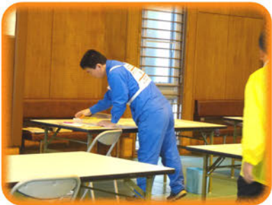
《種目》オフィスアシスタント

そして、自分は作業を行う時に常に確認不足の事が日常の仕事の中で多かったのですが、今回のアビリンピック大会のおかげでいかに確認の大切さが良く分かったので、今回経験した事をこれからの仕事でも生かせるようにしたいと思います。