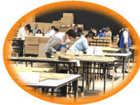
《種目》製品パッキング