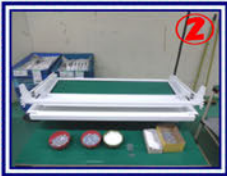
②棚板組立とア-ツァ-組立を合体し、さらに6点の部品を取り付け完成 ア-トライバ-工具使用