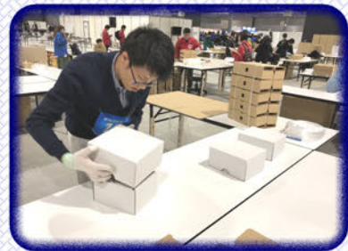
《種目》製品パッキング

競技の本番は少し戸惑いがありました。入賞はできませんでしたが、自己ベストを更新し、自分なりの成果を出せたので満足かなと思います。