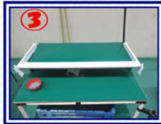
③ア-ツァ-組立(前組み) ア-トライバ-工具使用