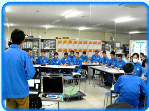
~産業医と社員の様子~