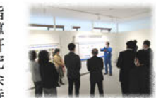
11月26日、兵庫高等学 校進路指導研究会特別支援学校部会