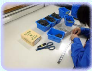
角ナットにスポンジ貼付け

指導員一名で、直接の製造実務には不慣れな面もありますが、社員2名、関係部署と協力して業務を進めております。